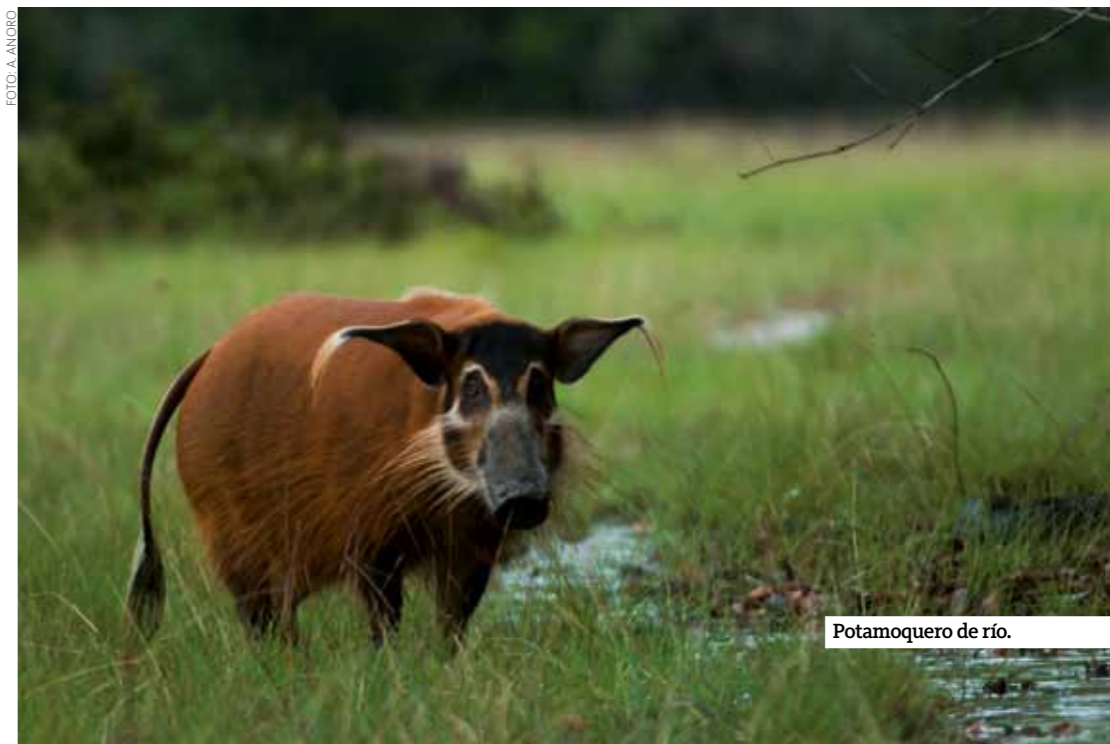
Potamoquero de río.