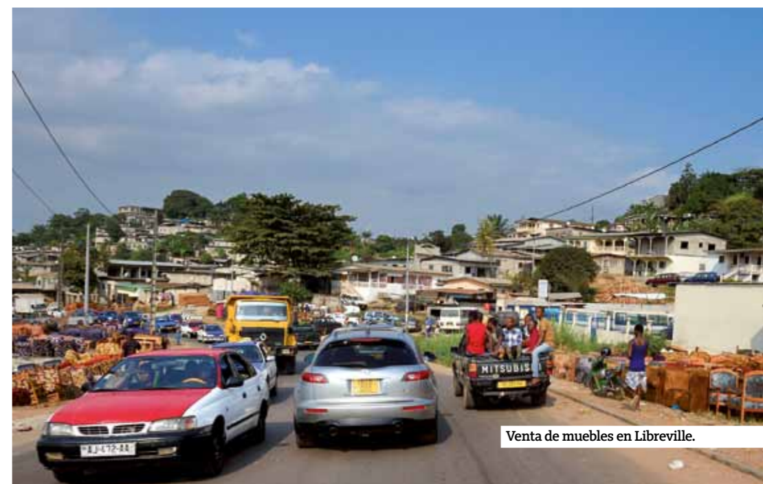
Venta de muebles en Libreville.