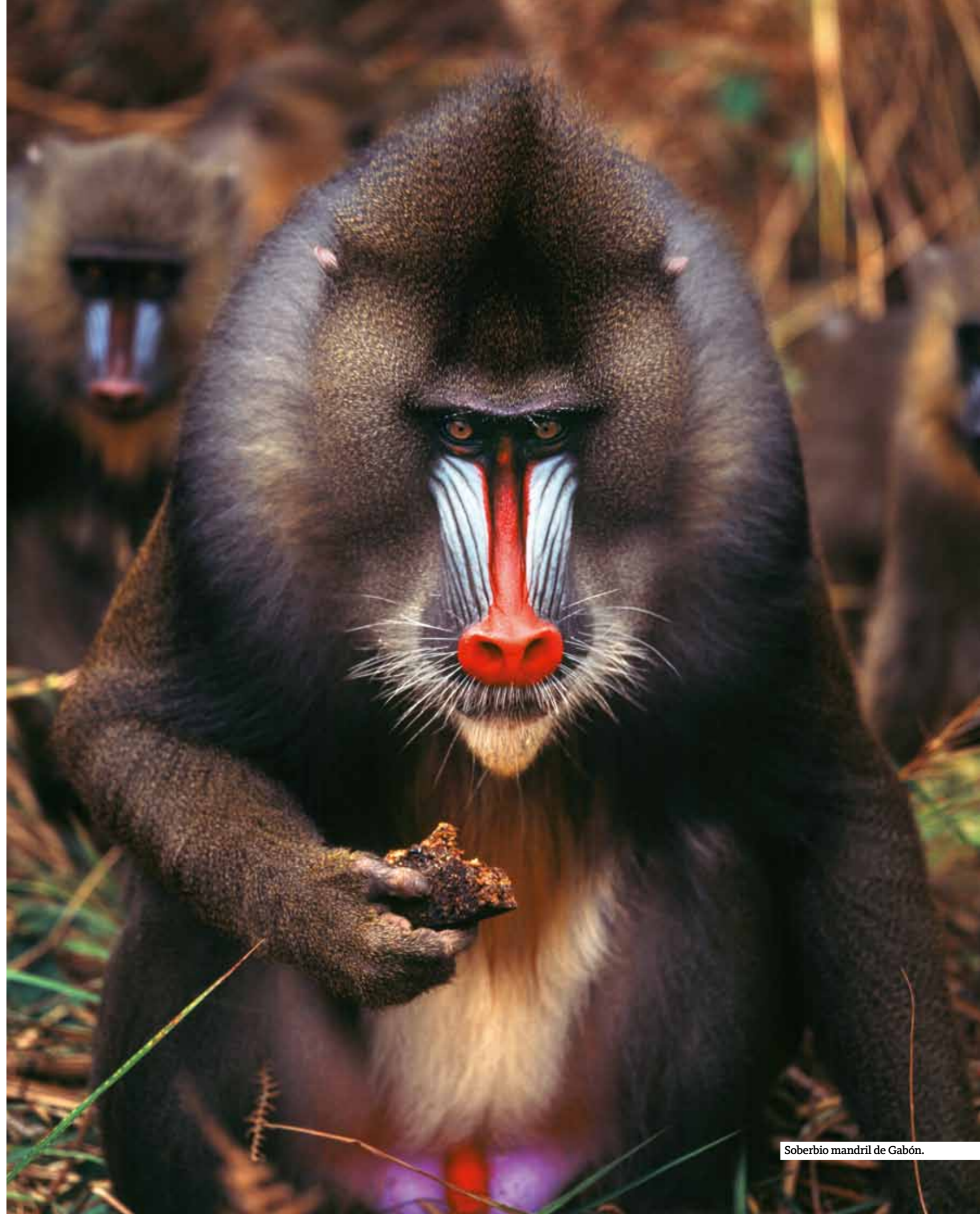
Soberbio mandril de Gabón.

Una visita prácticamente obligada en la ruta que lleva hacia los Parques Nacionales del suroeste del país es el hospital que el Premio Nobel de la Paz doctor Albert Schweitzer fundó en la ciudad de Lambarene, a orillas del río Ogooué, a principios del siglo pasado. El hospital y su zona histórica perfectamente conservada permiten zambullirse en el África colonial y conocer la historia de este polifacético