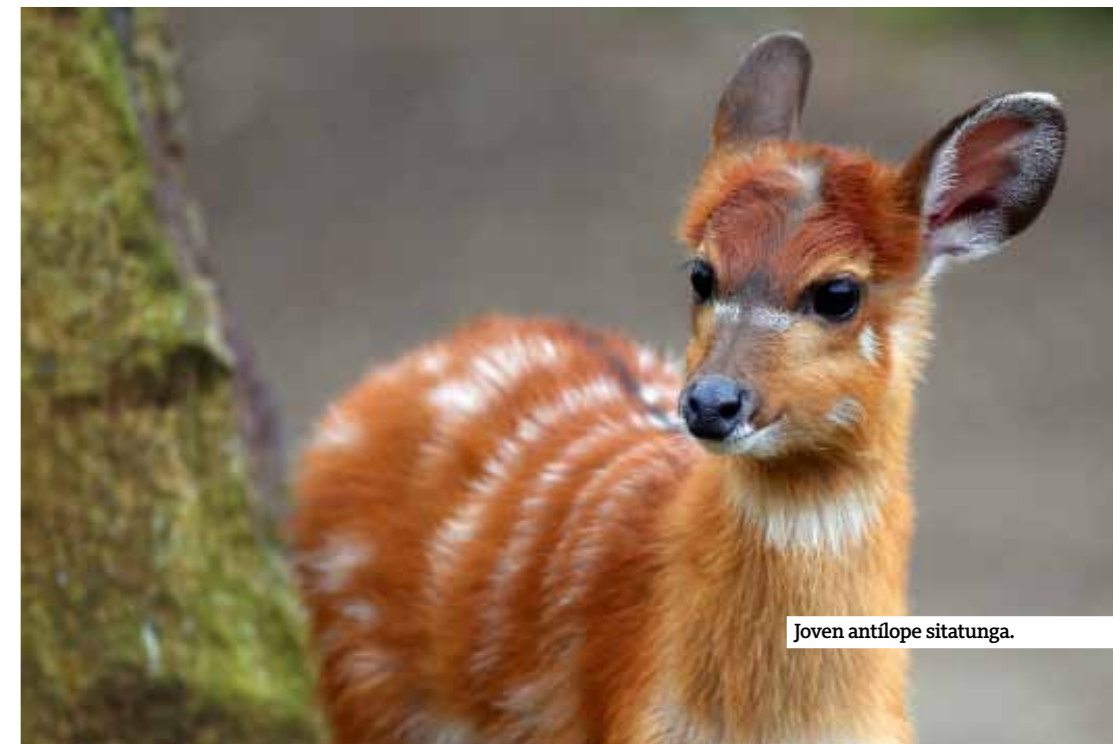
Joven antílope sitatunga.

mo destino: el Parque Nacional de Loango. Mayumba es conocida por ser uno de los mejores lugares de África para la pesca de grandes peces desde la playa y uno de los lugares favoritos para la puesta de la tortuga laúd entre los meses de noviembre y enero. Sus kilométricas playas desérticas que llevan hasta el Congo atravesando el Parque Nacional de Mayumba son el lugar ideal para que estas gigantes del mar se sientan seguras durante la preciosa puesta de sus huevos. Ver salir a este gigante con un esfuerzo épico de su hábitat natural es más que emocionante. Algo más al norte, en la ciudad de Gamba, hay que cambiar el coche por el barco si pretendemos llegar a Sette Cama, frontera sur del Parque de Loango. Sette Cama se ubica entre la laguna de Ndogo y el Atlántico, flanqueada por playas interminables, sabanas costeras y selva tropical. Aquí se concentra la esencia de toda la fauna de Gabón y en la época de lluvias