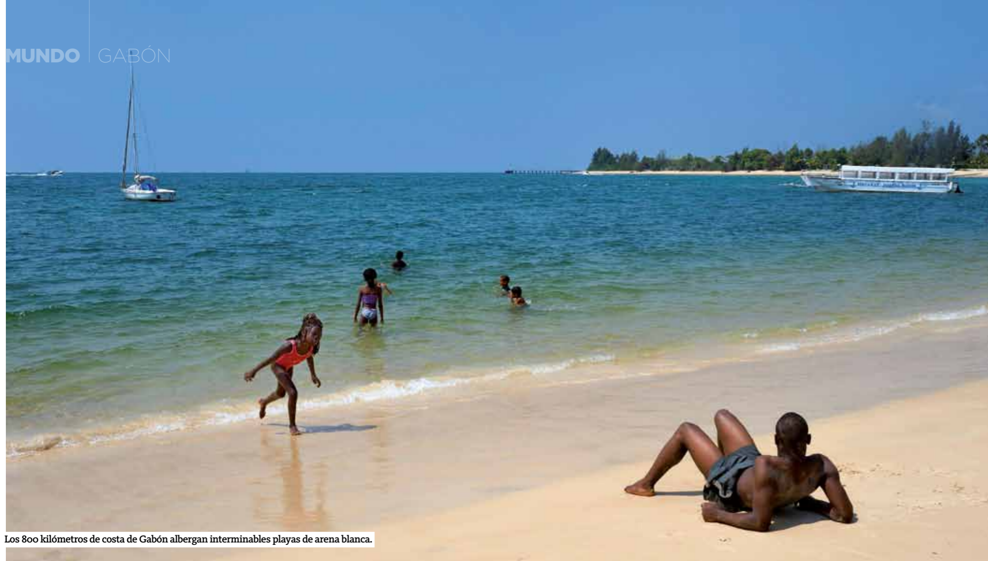
Los 800 kilómetros de costa de Gabón albergan interminables playas de arena blanca.

V iajar a esta ex colonia francesa es una experiencia transformadora, casi iniciática. La obligada inmersión –muchas veces a pie– en su desbordante naturaleza salvaje, el encuentro con la tradición espiritual del Bwiti y con las creencias místicas que impregnan a una gran parte de la población, y la ausencia de un turismo masivo consiguen que, después de una expedición por estas tierras, el viajero occidental sienta que ha viajado en el tiempo, que haya realizado una especie de retorno a las raíces del hombre. Libreville, la capital, es amable y acogedora. Una ciudad tranquila en la que vive alrededor de un millón de personas (casi el 70% de la población total del país), y en donde se entremezclan locales de más de 40 grupos étnicos –entre ellos los bantúes Fang, Tsogo, Punu, Teke, Kota y los