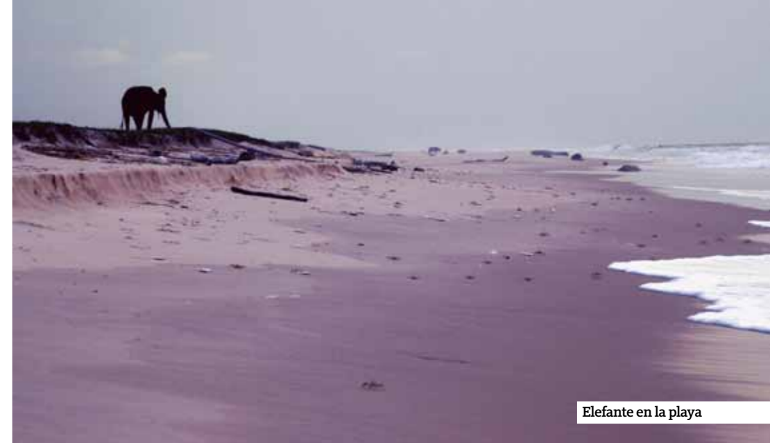
Elefante en la playa