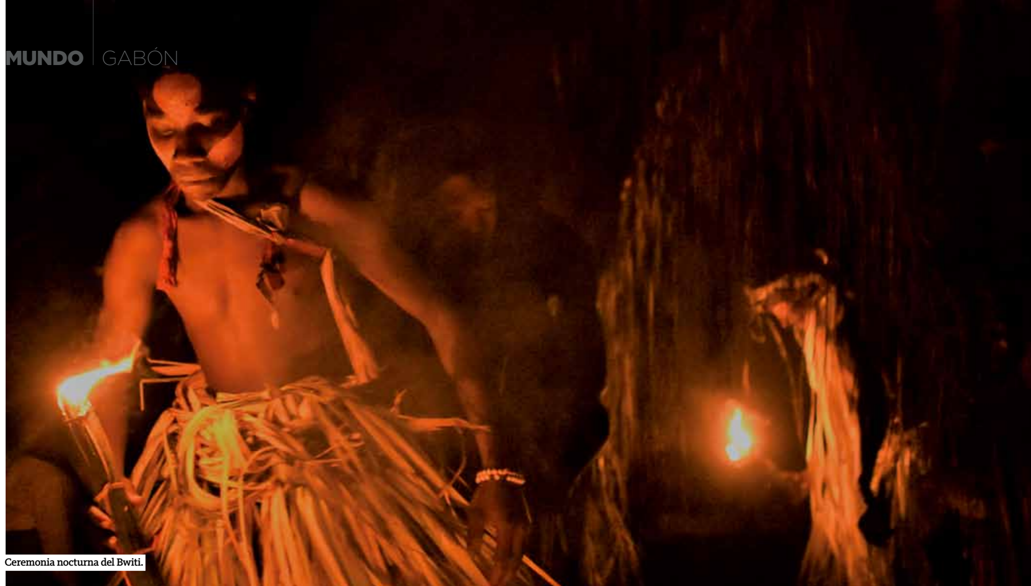
Ceremonia nocturna del Bwiti.