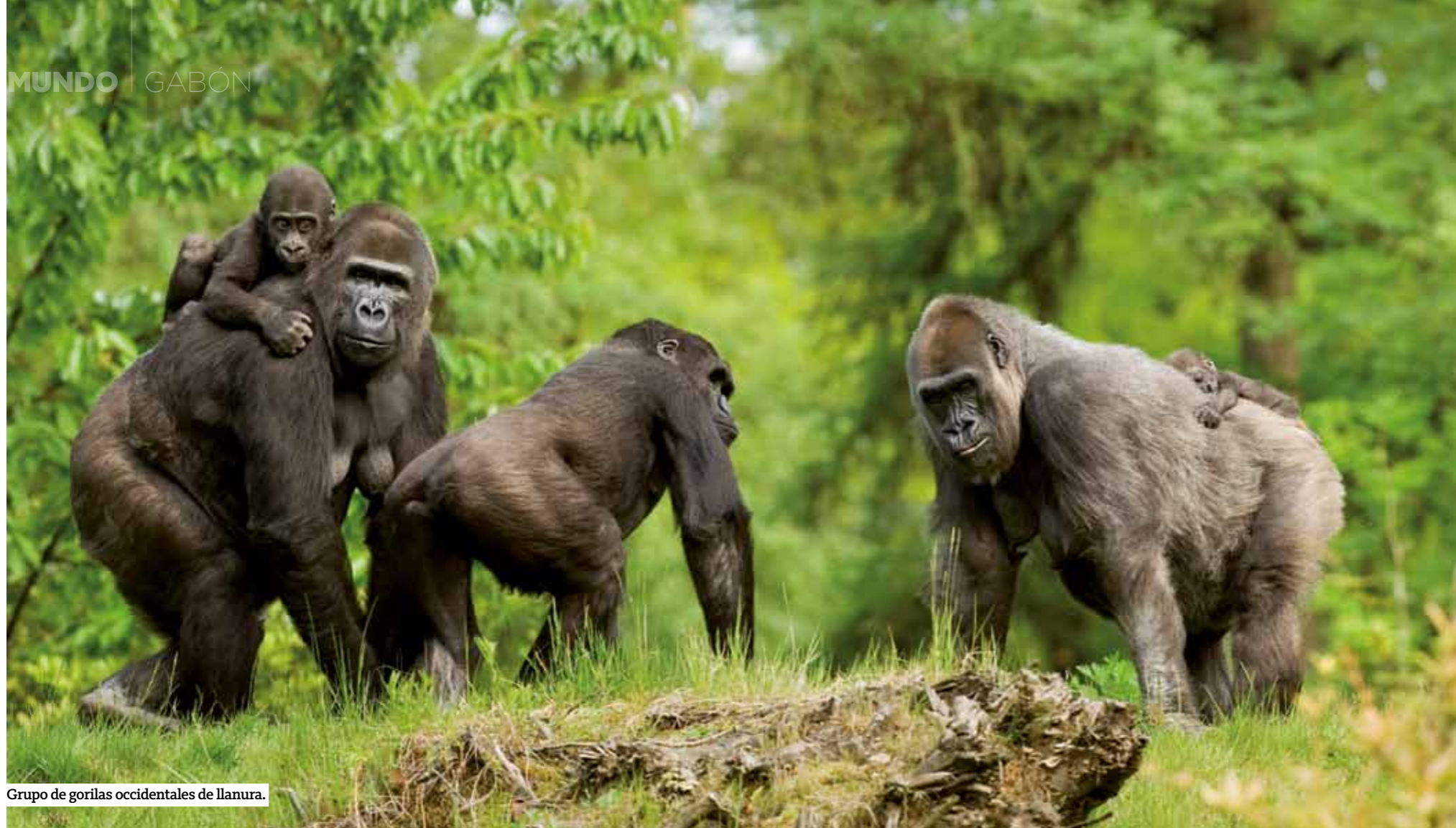
Grupo de gorilas occidentales de llanura.

las praderas costeras se pueblan de hierba fresca rica en minerales. Los meses entre noviembre y mayo son los más favorables para observar a los elefantes en la playa. Importante acercarse siempre a contra viento y acompañado por ecoguias locales. Y si hay un lugar en el que las medidas de seguridad para un paseo a pie cobran especial relevancia es en el trekking desde Sette Cama a la selva de Akaka. Dieciocho kilómetros a través de la selva en los que Zico y Kasa, expertos ecoguias, nos guiarán hasta un lugar único en el corazón del Parque Nacional de Loango, la joya de los parques de la República de Gabón. Entre junio y septiembre, en la estación seca, un acontecimiento natural otorga a Akaka el merecido apelativo de Último Edén de África . El nivel de las aguas que inundan la zona descendiendo y deja al descubierto grandes extensiones de tierra que se cubren de jugosa hierba, rica en nutrientes. Además, quedan expuestos caracoles,