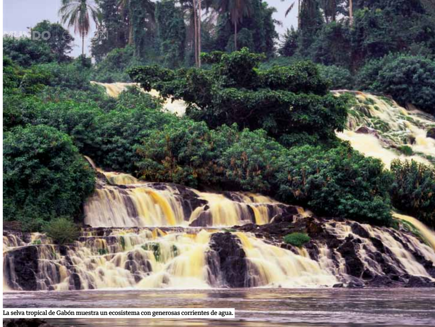
La selva tropical de Gabón muestra un ecosistema con generosas corrientes de agua.

Son ecosistemas ricos, variados y relativamente intactos. En la selva se cobijan las mayores poblaciones de elefante de bosque africano, bosque que sustenta concentraciones de grandes simios como el gorila de llanura, el chimpancé o el colorido mandril, y los ríos acogen tres especies de cocodrilo: el gran cocodrilo del Nilo, el falso gavial y el cocodrilo enano. En el mar, entre julio y septiembre cientos de ballenas jorobadas se refugian con sus crías en las aguas costeras, muy ricas en nutrientes. Tan pronto se marchan las ballenas, comienza la época de desove de las tortugas marinas, que se prolonga hasta el mes de febrero. Los citados ochocientos kilómetros de costa casi virgen son el hogar de tres especies de tortugas: la tortuga olivatre, la tortuga verde y la impresionante tortuga laúd, que llega a pesar casi una tonelada. Los meses de diciembre y enero conforman la época de desove de la tortuga marina. Es también la época en la que se produce un acontecimiento muy especial en Gabón: la posibilidad de avistar elefantes y otros grandes mamíferos en la playa.