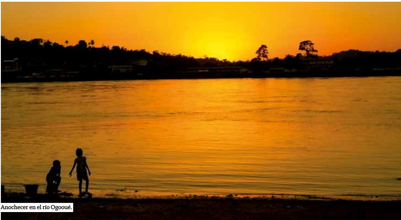
Anohecer en el río Ogooué.